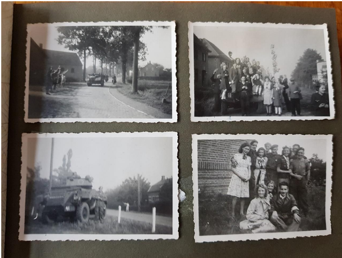
8. 19 september: Eersel bevrijd!