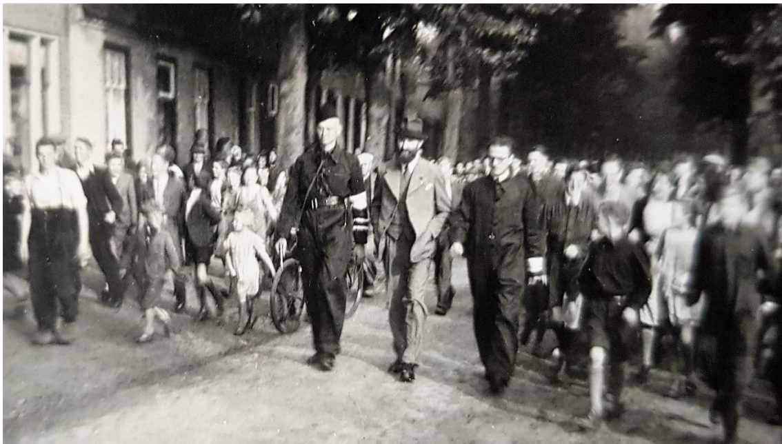
9. Arrestatie van NSB-burgemeester door leden van het verzet.

Muziek: Gelegenheidskoor Gaudeamus